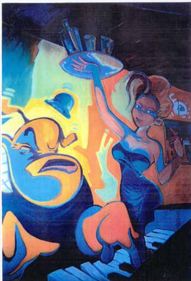
Fresque de Loïc Tellier