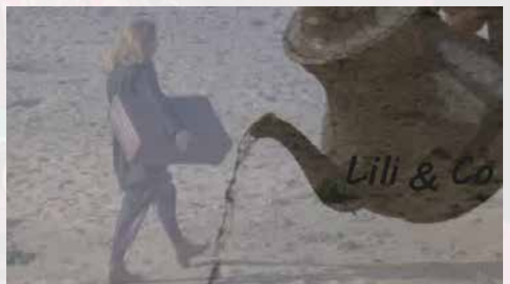
CLIP IL ETAIT PLUSIEURS FOIS

https://www.youtube.com/watch?v=L9maXaaqjDM