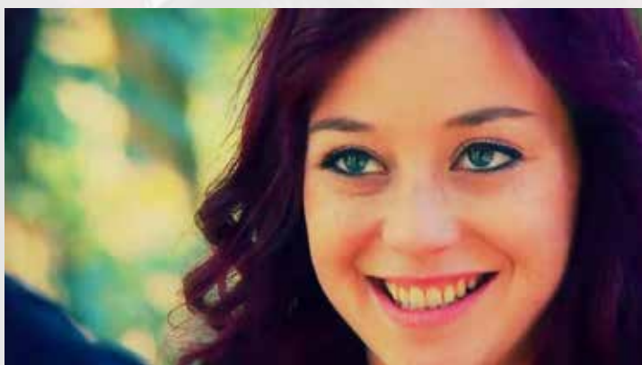
CLIP L'AGE D'AIMER (Réalisation Mikaël Dinic)

https://www.youtube.com/watch?v=L9maXaaqjDM