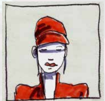
Dessins de Loïc Tellier

L'équipe recherche une esthétique cohérente.